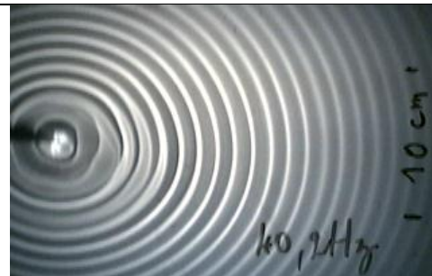
2/ Fréquence f = 40,2 Hz Longueur d'onde \lambda = \dots\dots\dots cm